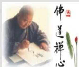
Master Hsing Yun

Hier volgt de vertaling van een klassiek Chan (Zen) verhaal over Meester Huineng, die het Chinese Chanboeddhisme (Zen) vorm heeft gegeven. De toelichting aan het einde is van Meester Hsing Yun. Het is verschenen in het boek: