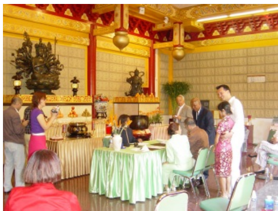
Trouwen in de tempel

Slechts door een standvastige aanpassing van onze levens aan ons geloof en wanneer we onze levens volgens de voorschriften van de Dharma inrichten, kunnen we beginnen om het vermogen tot zelf-onderricht en zelf-gewaarzijn te ontwikkelen. Zo krijgen we inzicht in de wijze waarop de Boedha leefde. Slechts dan kunnen we de ware betekenis van de Dharma en zijn verdienste voor de mensheid werkelijk waarderen. Het centrale thema van de toespraak van dit jaar is: "Zelf-gewaarzijn en het praktiseren van Boedha's Weg". Ik hoop dat u de vier hoofdpunten daarvan wilt overnemen als doel van uw toekomstige ontwikkeling.